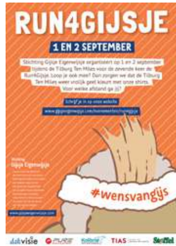
A3 poster - Ten Miles