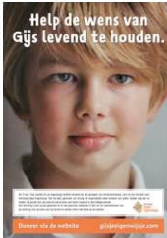
A3 poster - Algemeen